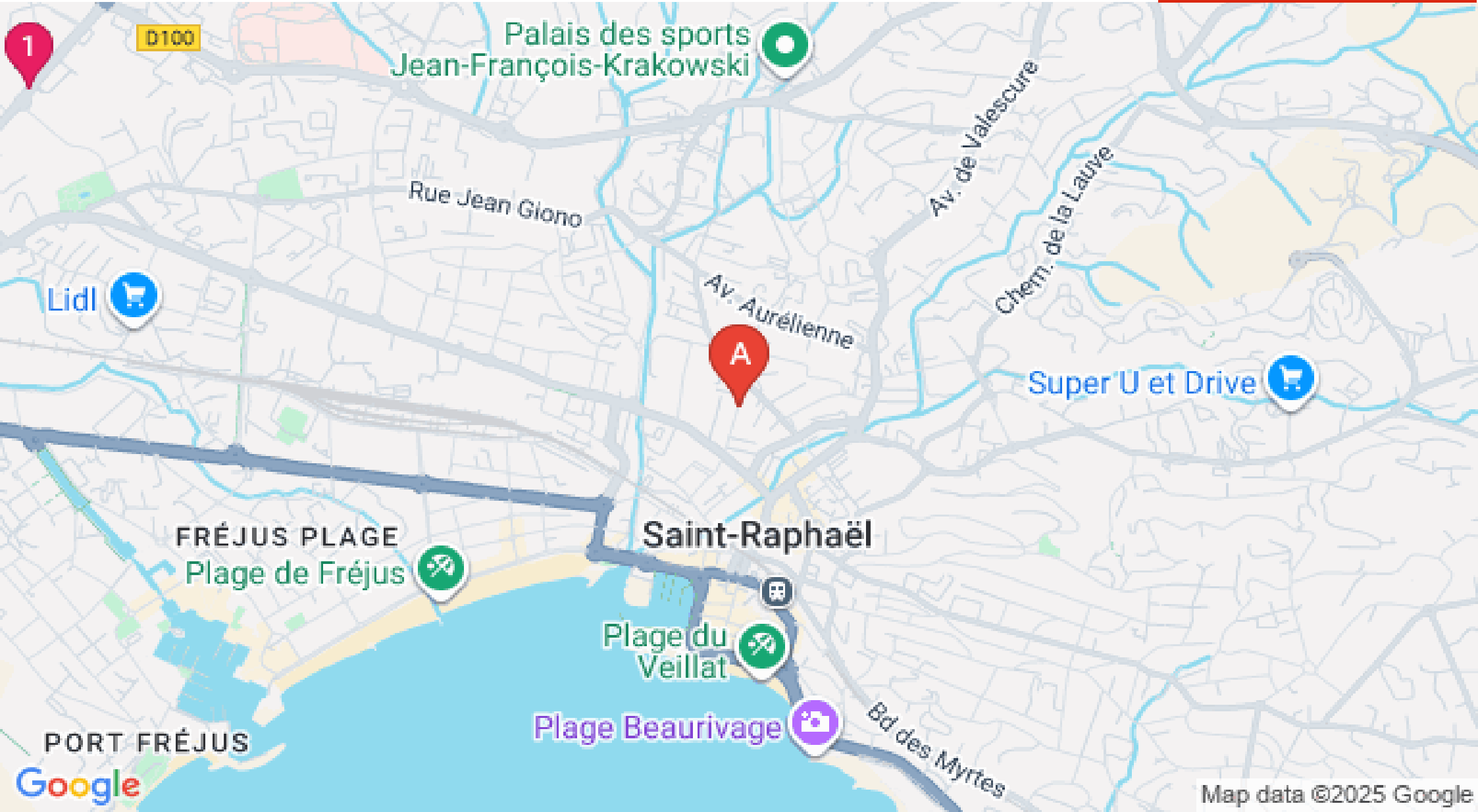
Map data ©2025 Google